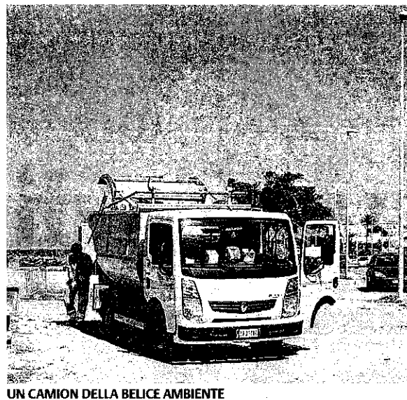
UN CAMION DELLA BELICE AMBIENTE